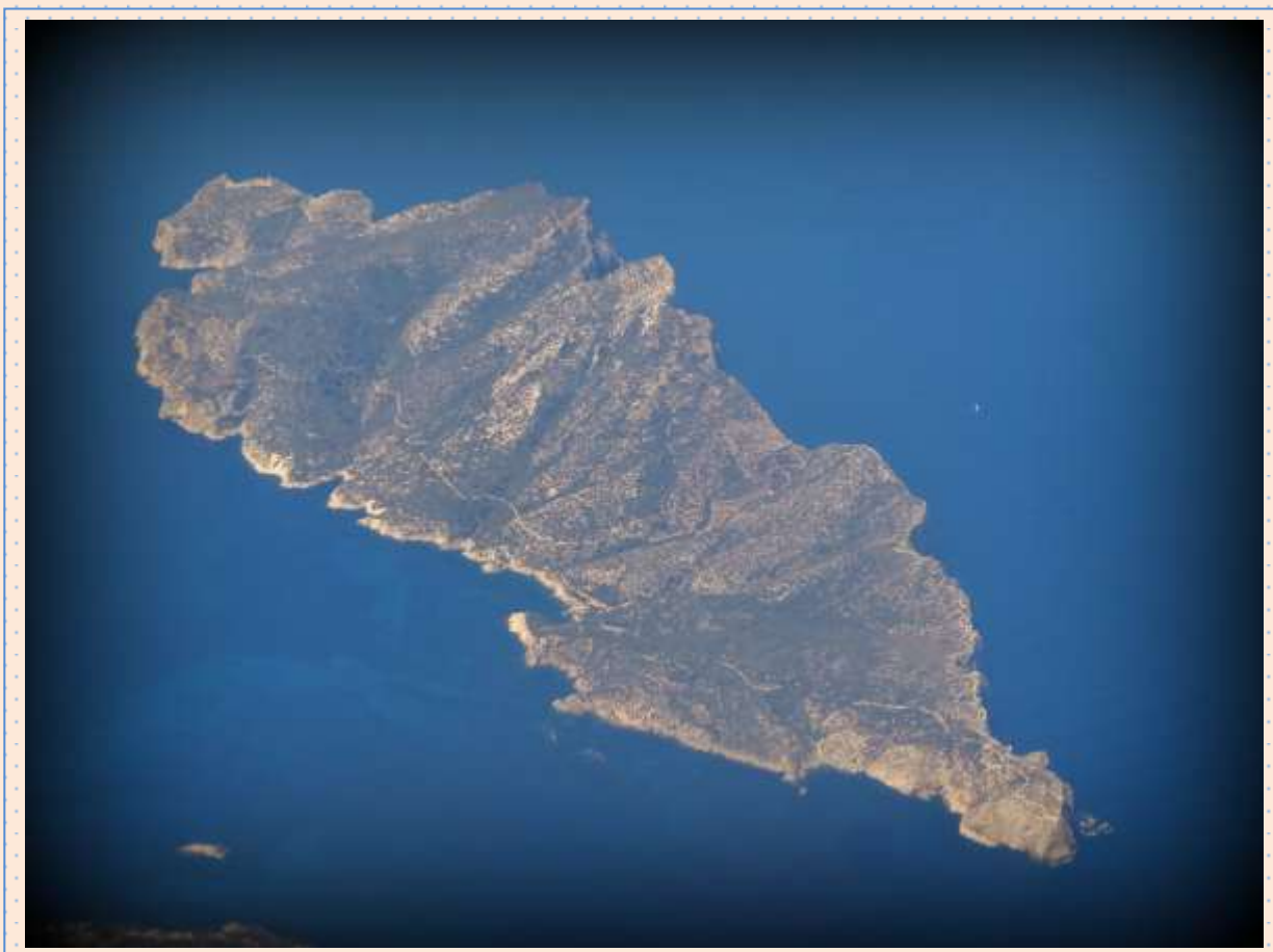
Sa Dragonera en panoràmica aèria. Declarada Parc Natural el 1995. Foto: Joan Mateu, juny de 2014.

SEU FEAE-Illes Balears: IRIE-UIB C. Miquel dels Sants Oliver, 2 - 1r. - 07122 Palma de Mallorca Tf.: 971.172408; Fax: 971.172401 feaeib@gmail.com http://feaeib.blogspot.com http://www.feaes.es/